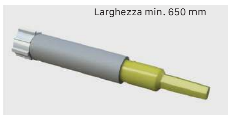
Freno a molla "ADAGIO"