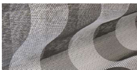
Rete a fasce BIANCO - NERA