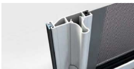
Profilo rinforzo maniglia laterale