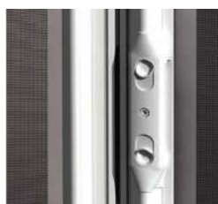
Blocco due ante con CRICCHETTO